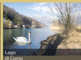
Lago di Como