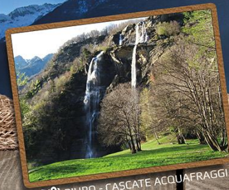
PIURO - CASCADE ACQUAFRAGGIA

Die Phantasie und der Abenteuergeist eines jeden können auch andere Wege entdecken, die weniger bekannt, aber vielleicht suggestiver sind.