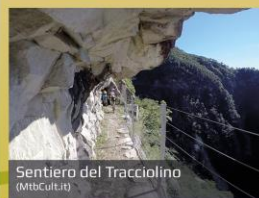
Sentiero del Tracciolino (MibCULTURE)