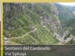
Sentiero del Cardinale Via Spluga